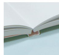
クータバインディング

筆記のしやすさ、アレンジのしやすさを考え、書き込むスペースを大きくとったシンプルな罫設計になっています。