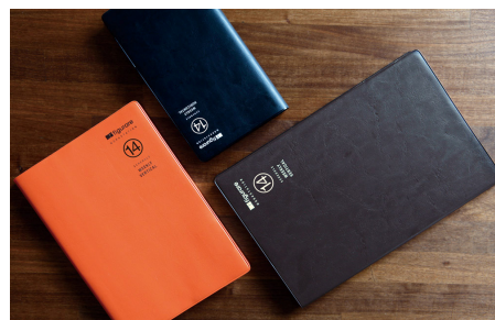
※ビジネスシーンにも最適な3色展開