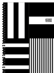
SW145B (ストライプ×ボーダー)