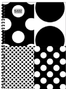
品番: SW145A (ドット)