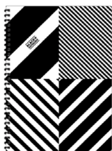
SW145D (ストライプ×ストライプ)