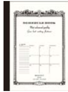
品番: CS801 (A5サイズ)