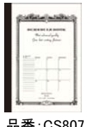
品番: CS807 (B6サイズ)