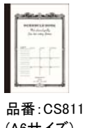
品番: CS811 (A6サイズ)