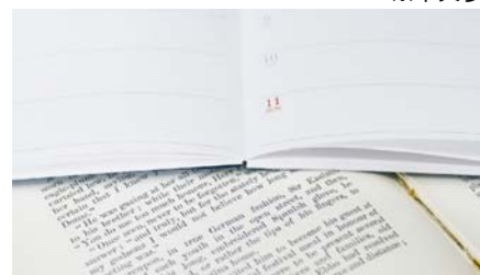
※フラットにひらく糸かがり綴じ製本