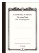
品番: CS701 (A5サイズ)