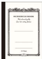
品番: CS607 (B6サイズ)