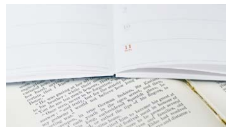
※フラットにひらく糸かがり綴じ製本