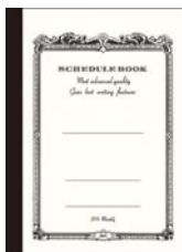
品番: CS601 (A5サイズ)