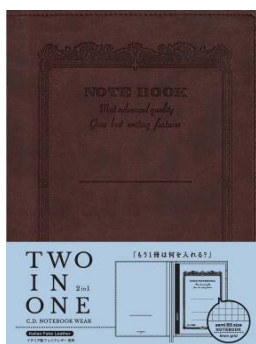
品番: CDV250-BR (セミB5サイズ用)