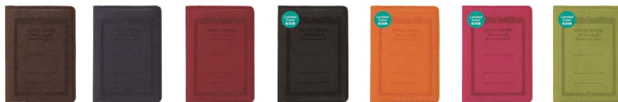
CDV130-BR CDV130-NV CDV130-RD CDV130-BK CDV130-OR CDV130-PK CDV130-YG (A7サイズ用) (限定色) (限定色) (限定色) (限定色) (限定色)