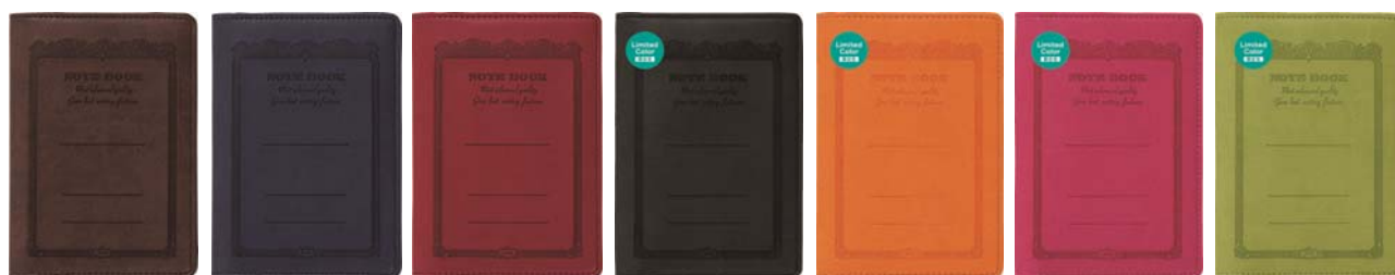
品番: CDV150-BR CDV150-NV CDV150-RD CDV150-BK CDV150-OR CDV150-PK CDV150-YG (B7サイズ用) (限定色) (限定色) (限定色) (限定色) (限定色) (限定色)