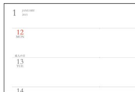
※本文参考画像(ウィークリーページ)

メモページはマンスリータイプで26ページ、ウィークリータイプでも20ページ分ありますのでたっぷり書くことができます。