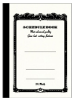
品番: CSB6M5-W (B6サイズ)