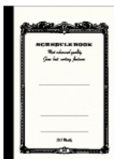
品番: CSA5M5-W (A5サイズ)